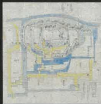
大田原城土居石修補絵図」