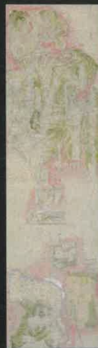
創庫可經「封城郷村図」(部分)

近世の大田原市は、大田原藩と黒羽藩の二つの藩が配され、いずれも改易や転封を経験せずに、明治まで続きました。この時代の城館や城下町、村落等の絵図は、当時の様子を知ることができる貴重な資料です。